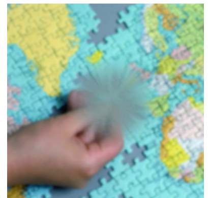
Sehen mit Makula- Degeneration (AMD)