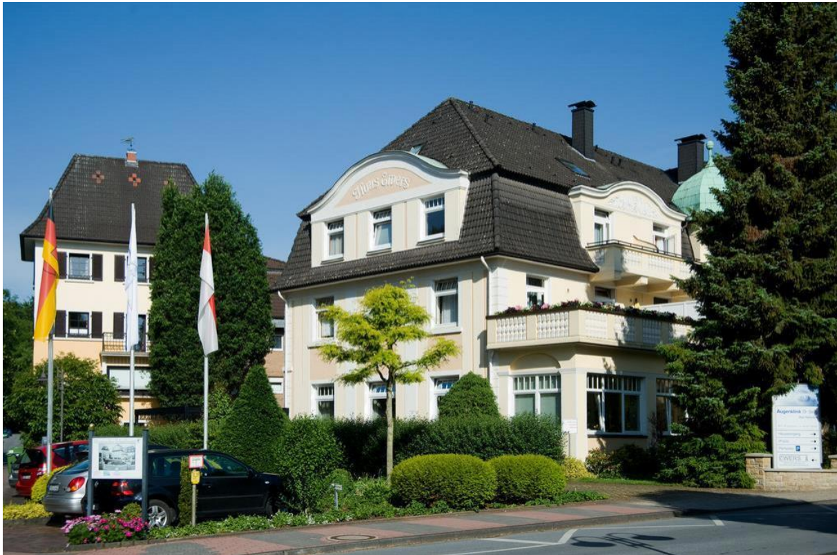
Augenlinik Dr. Georg im Herzen des Kurparks von Bad Rothenfelde